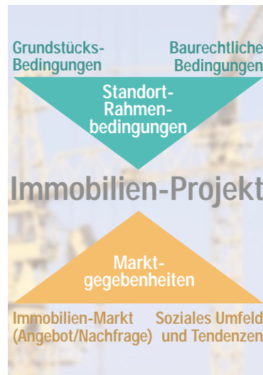
Rahmenbedingungen für Immobilien-Projekte

Voraussetzung für die Projektierung von Bauträgermaßnahmen ist eine exakte Markt- und Standortanalyse. Jeder Projektentwickler ist daran interessiert, das